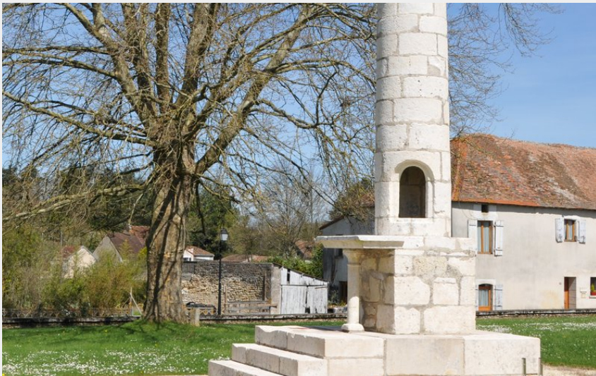
(© Béatrice Guyonnet)