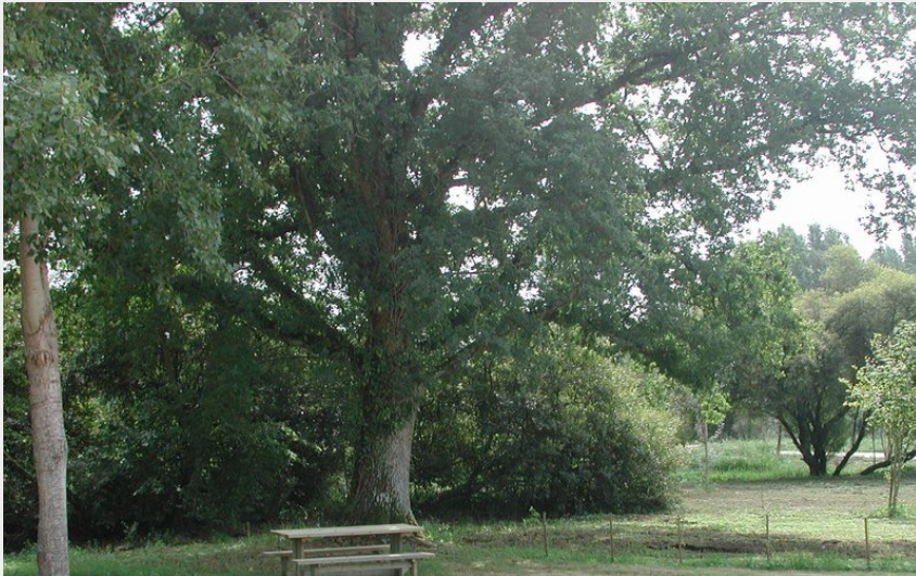
Aire de pique-nique d'Usson du Poitou