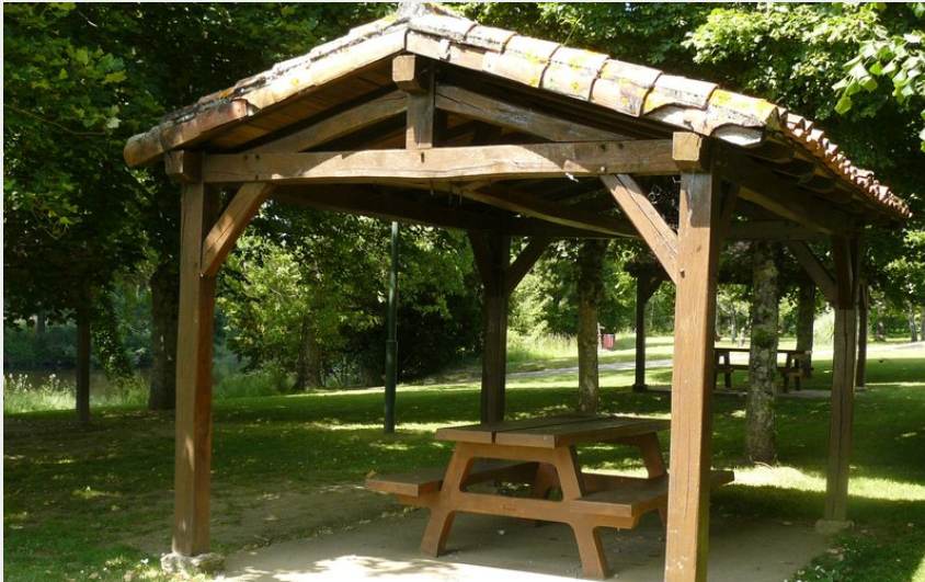
Aire de pique-nique de Saint-Germain