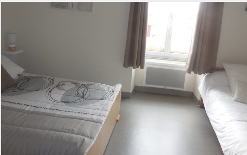
Crédit photo : Hôtel de l'Abbaye - St Savin - 2017 - ©Hôtel de l'Abbaye (1).JPG_3 (ACAP)